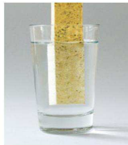
purenit® quillt nicht auf. Selbst nach 10 Tagen im Wasser verändert sich die Materialstruktur nicht.